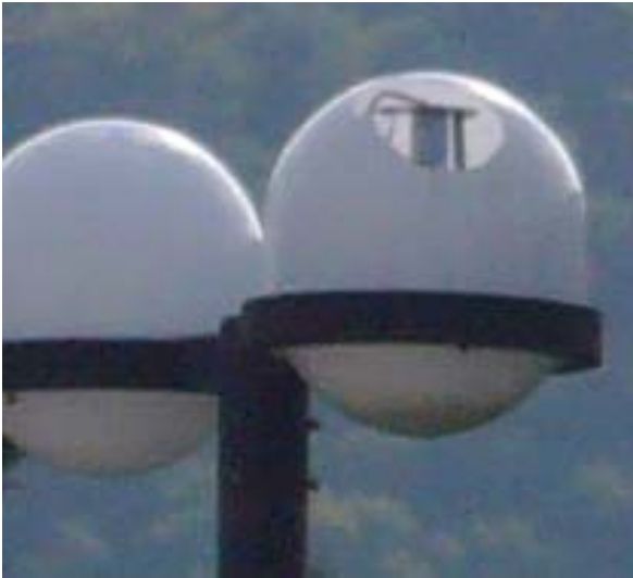
器具が破損した状態で使用