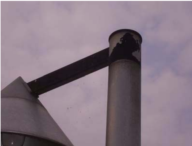
非耐塩屋外用器具を海岸隣接地域に設置