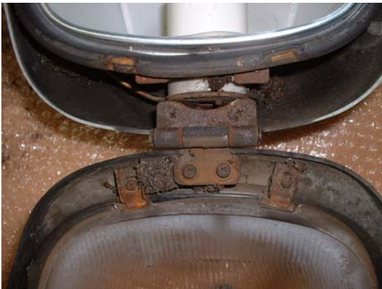
部品が錆びた状態で使用