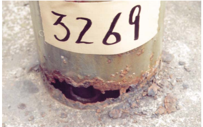
孔があいた状態で使用