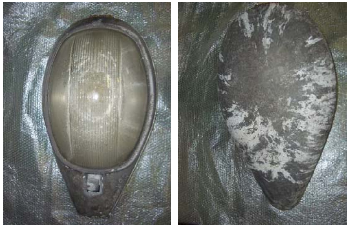
塗装が劣化した状態で使用