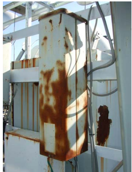
錆びた状態で使用